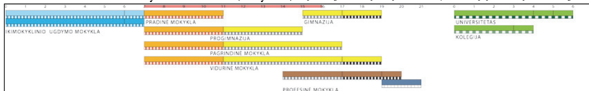
Schéma vzdělávacího systému v Litvě (Eurydice) https://webgate.ec.europa.eu/fpfis/mwikis/eurydice/index.php/Lietuva:Ap%C5%BEvalga