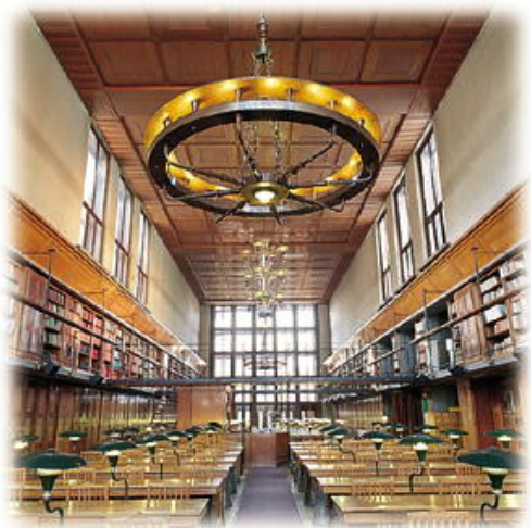
Hlavní čítárna Národní a univerzitní knihovny v Lublani

Vysokoškolské vzdělávání nabízejí univerzity a jednotlivé vysoké školy: fakulty a specializované školy. Univerzity a jednotlivé fakulty obvykle poskytují akademické i odborně orientované studium, zatímco odborné školy nabízejí hlavně odborně orientované studium. Pokud splňují akademické standardy pro personál a vybavení, mohou být akreditovány také pro poskytování doktorských programů, jinak musí být tyto programy uskutečňovány ve spolupráci s univerzitou.