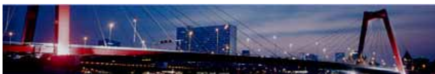
Most v Haagu

Děkujeme vám ještě jednou za přijetí nabídky k účasti na této studijní cestě. Za celý tým, který projekt Partnerství a kvalita (PaK) realizuje a podílel se na přípravě cesty, bychom vám rádi popřáli, aby cesta byla pro vás co nejvíce inspirativní, zajímavá, pro vaši další práci užitečná a poučná. Při přípravě jsme se snažili, aby program tomuto cíli co nejvíce napomáhal.